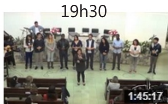
Grupo "Vocal Livre" | 01/06/2014 | IPAmericana 39 visualizações 1 dia atrás

Este é o canal em que os cultos, pregações e outros vídeos serão postados. Conheça e divulgue.